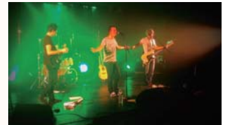
Le groupe français Exocet en 2e partie du 13 décembre.