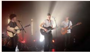
The Wranglers (Trowbridge) a ouvert le festival le 13 décembre.

Les 13 et 14 décembre, le jumelage Charenton-Trowbridge organisait la première édition du festival de pop-rock "Deux airs de pop" au Petit T2R. Objectif : confronter la pop française à la pop anglaise mais aussi l'art des Français de jouer la pop anglaise. Deux groupes de Trowbridge sont venus défendre les couleurs britanniques : The wranglers Sulis ont ouvert brillamment le festival et les Collision Course l'ont terminé en mettant "le feu" sur la scène et le public. En face, les groupes français ont tenu le rang. D'un côté, Exocet a bien défendu l'art de la pop et du rock français, en y ajoutant quelques classiques des Beatles. De l'autre, Rocking Kills a convaincu sur ses reprises de Radiohead, Pixes ou de Muse. Ces deux jours de concert achevés, les groupes, les bénévoles et les familles d'accueil se sont retrouvés dans un PUB du village de Bercy avant une balade nocturne sur les Champs-Élysées. A présent, les échanges se poursuivent... sur la page Facebook du jumelage anglais.