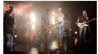
Collision Course (Trowbridge) a enflammé et cloturé le festival.