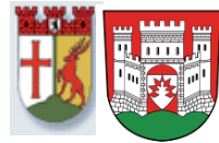
Berlin Tempelhof - Büren Allemagne