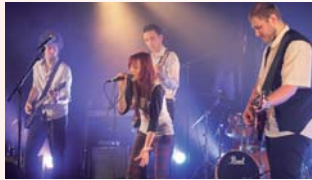
Le groupe français Rocking Kills a partagé ses diverses reprises.