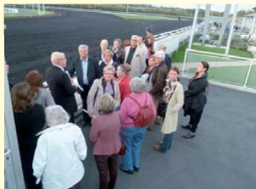
Les parieurs écoutent les explications

La soirée a débuté par une visite privée des coulisses, où un guide nous expliqua la vie des courses et en particulier le trot, spécialité de cet hippodrome. Ensuite, nous étions attendus au Restaurant "Le Sulky" pour un dîner qui a été rythmé par des paris sur les 7 courses du jour. Tout le monde s'est pris au jeu..... Bravo à tous les gagnants !