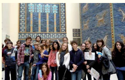
Un groupe très heureux à Berlin